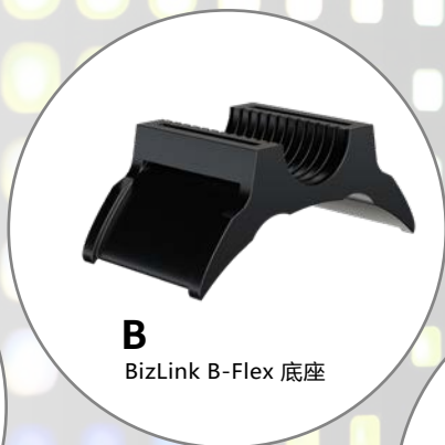
B BizLink B-Flex 底座