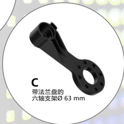
C 带法兰盘的 六轴支架 Ø 63 mm