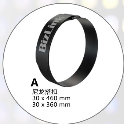
A 尼龙搭扣 30 x 460 mm 30 x 360 mm